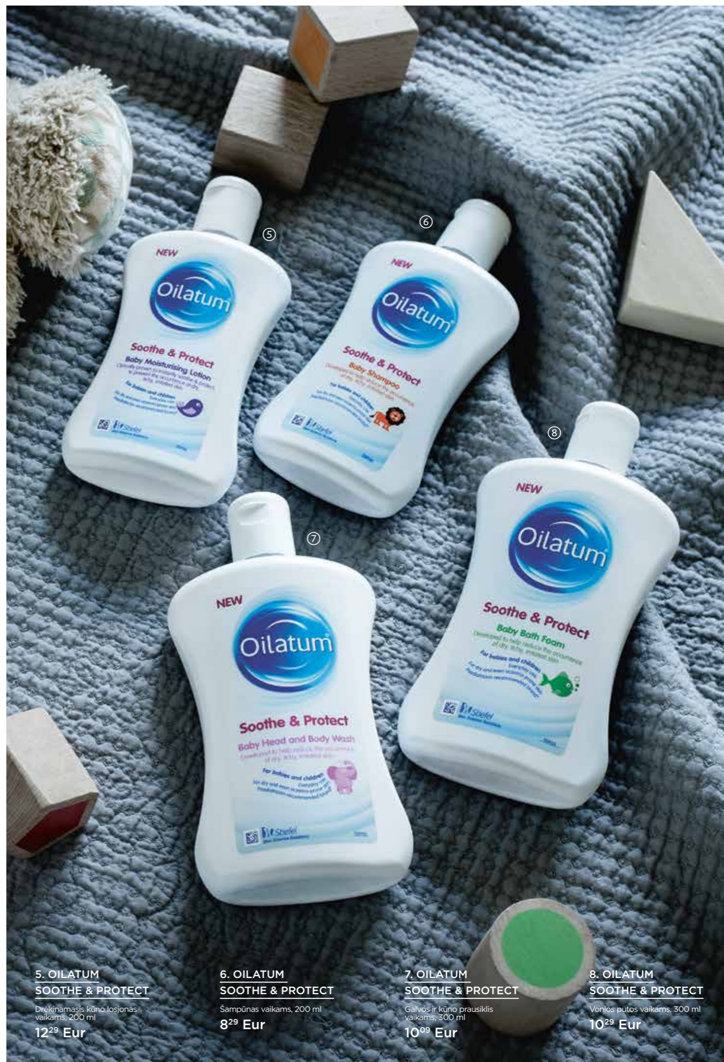
5. OILATUM SOOTHE & PROTECT Drėkinamasis kūno losjonas vaikams, 200 ml 12 29 Eur