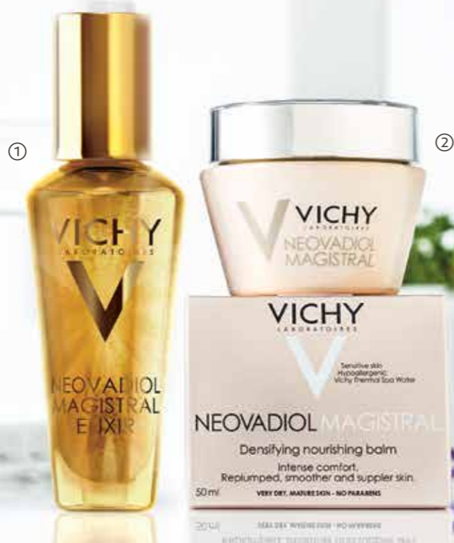
1. VICHY NEOVADIOL MAGISTRAL Serumas-eliksyras, 30 ml 47 99 Eur