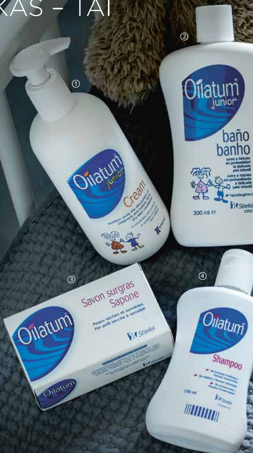
1. OILATUM JUNIOR Kremas vaikams, 350 ml 15 64 Eur

Daugiau informacijos teiraukitės UAB „GlaxoSmithKline Lietuva“, Ukmergės g. 120 Vilnius, tel. (8 5) 264 9000.